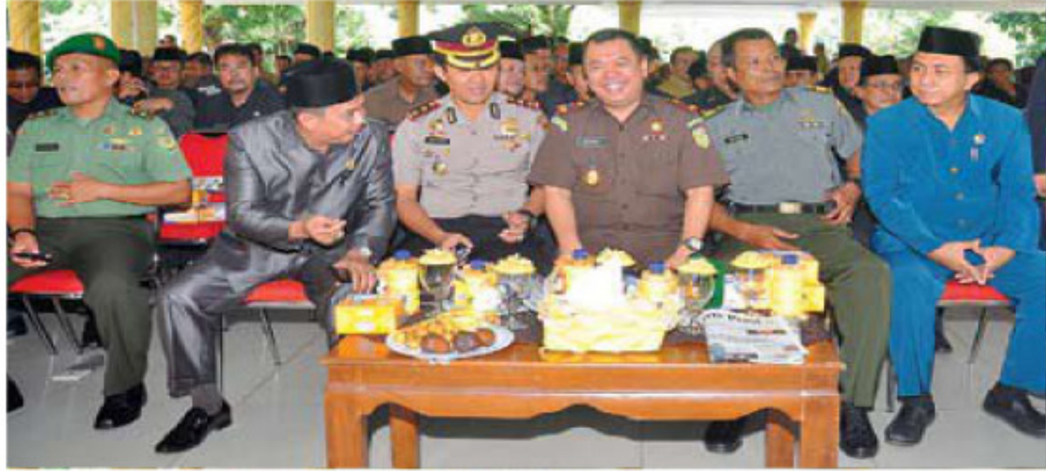
Unsur Muspida Kabupaten Muara Enim saat menghadiri pelantikan Sekda Muara Enim dan Kadis Dikbud Muara Enim.