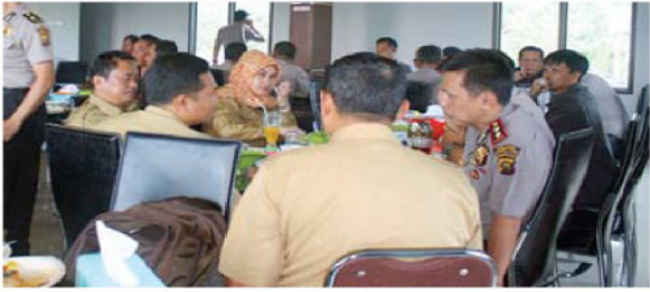
Suasana tatap muka antara Kapolres Pagaralam dengan wartawan se-Kota Pagaralam di RM Lesehan Legenda.