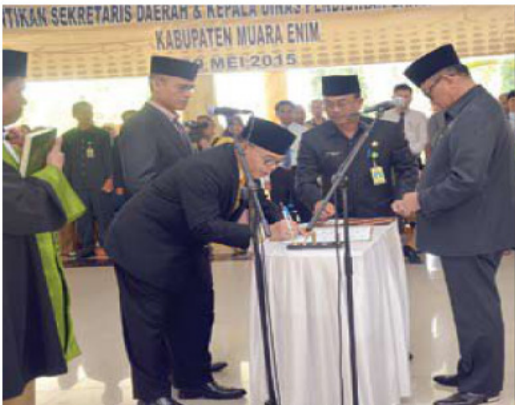
Sekda Muara Enim dan Kadis Dikbud Muara Enim menandatangani fakta integritas di hadapan Bupati Muara Enim.