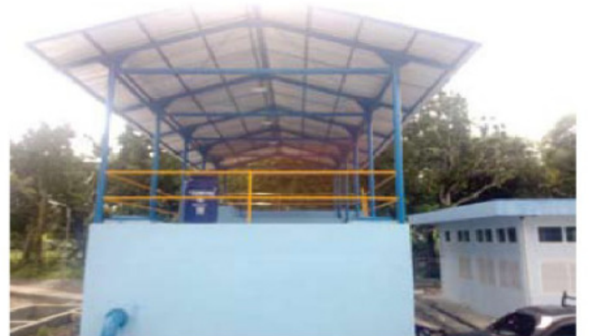
Bangunan IPA di Desa Kandis, Kecamatan Pampangan.