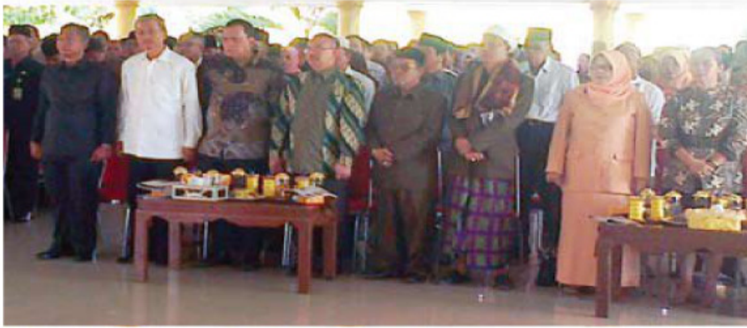
Tokoh masyarakat, tokoh agama turut hadir dalam pelantikan Sekda Muara Enim dan Kadis Dikbud Muara Enim.