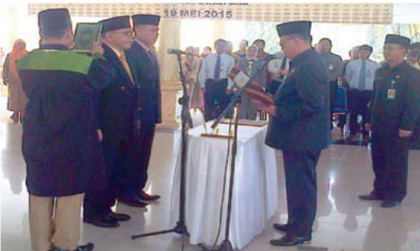
Pengambilan sumpah jabatan Sekda dan Kadis Dikbud oleh Bupati Muara Enim di atas Kitab Suci Al Quran.