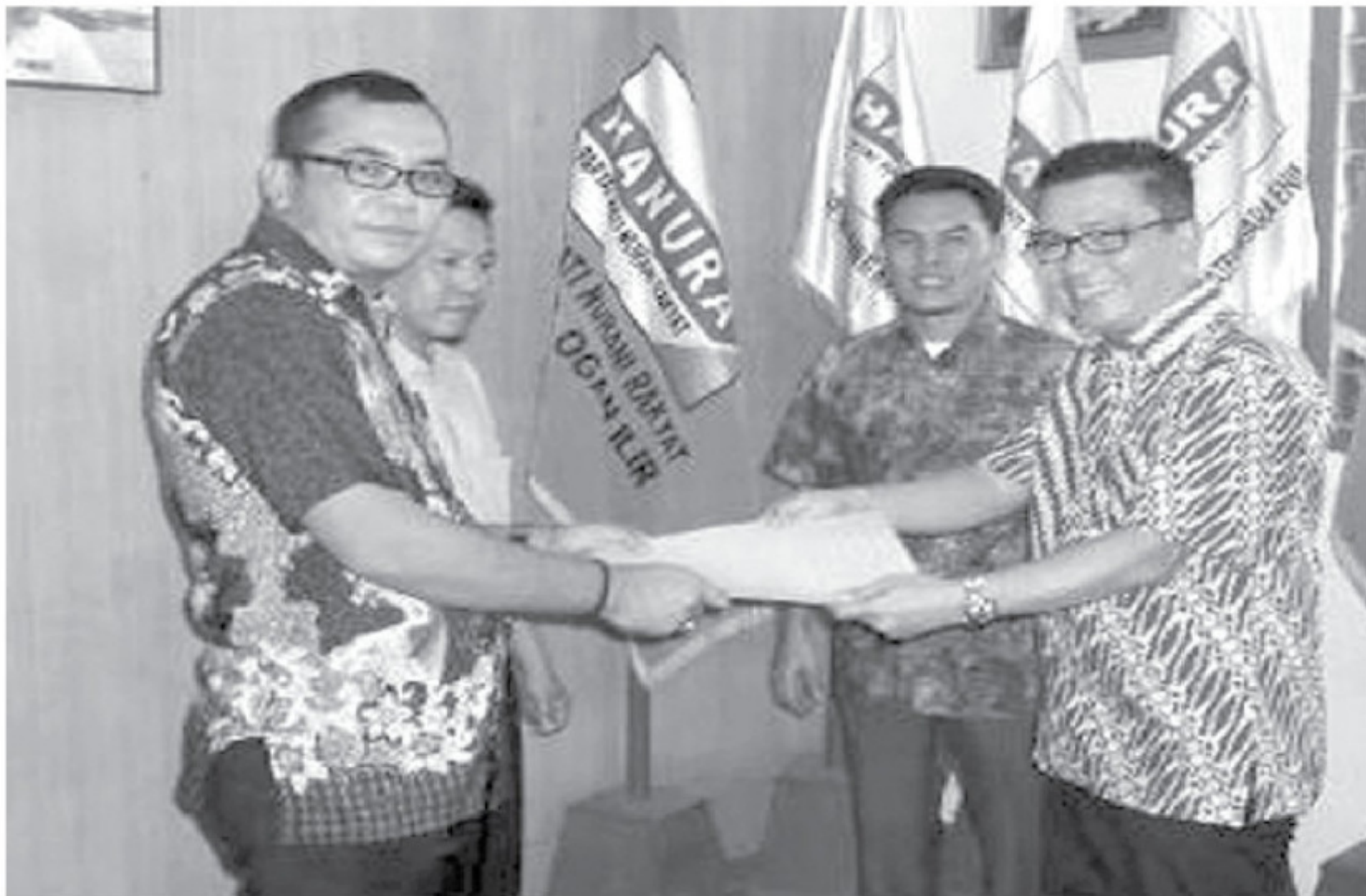
BELUM TENTUKAN SIKAP

"DPC yang menyampaikan calon yang sudah mendaftar. Selanjutnya DPD Provinsi Sumsel yang akan merekomendasikan sepasang Cabup dan Cawabup kepada DPP," jelasnya. ● VIV