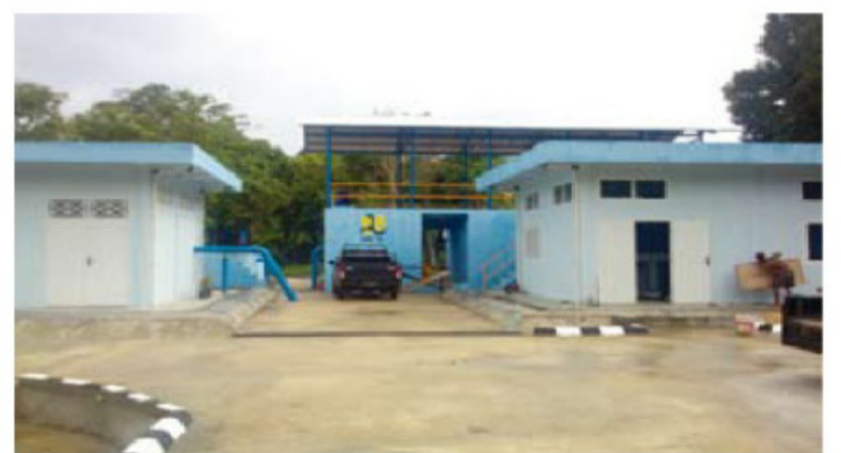
IPA Sungai Bungin, Kecamatan SP Padang.