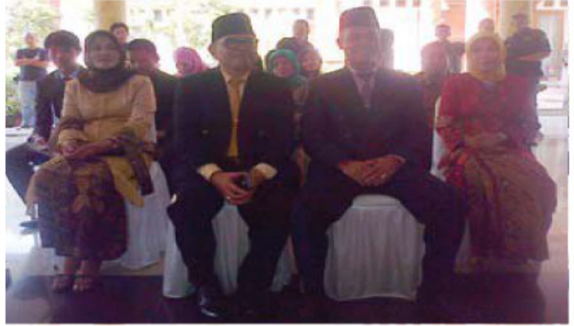
Sekda Muara Enim dan Kadis Dikbud Muara Enim didampingi isteri dan kerabat dekat.