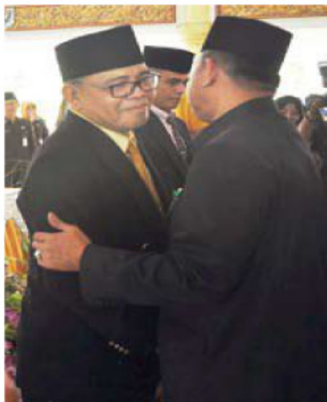
Sekda dan Kadis Dikbud mendapatkan ucapan selamat dari Bupati dan tamu undangan.

“Kemudian, untuk Kadikbud yang baru diminta untuk semakin meningkatkan kualitas pendidikan, bukan mengurus banyak proyek apalagi yang lain,” pungkasnya. ● HFB