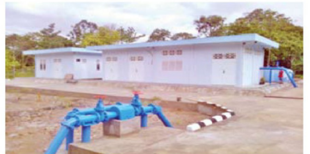
IPA Kandis, Kecamatan Pampangan.